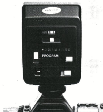
Den avancerede Canon 277 T flash blev en trofast følgesvend – og den arbejdede perfekt på Program-stillingen.

– Men samtidig afsløredes en uheldig ting. En af Canon A-1'erenes fordele er, at den viser blænde og lukkertid i søgeren med lysende tal. De kan altså ses selv om jeg sidder på 4. række i den mørke sal. T-70 viser godt nok lukkertiden på blændeauto- matik i det ydre LCD-vindue, men ikke i søgeren. Her ses kun blænden