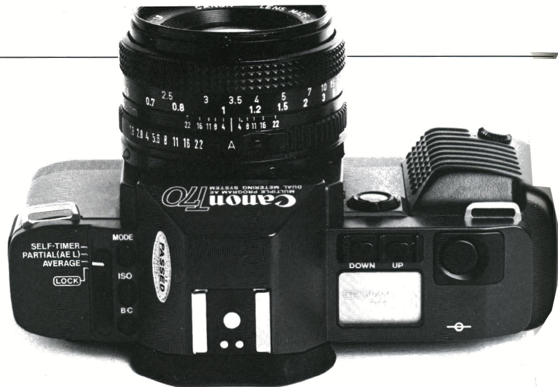
Et urtraditionelt design. Der »mangler« filmfremtræksarm, funktionsvælgeknop med lukkertider og tilbagespolingshåndsving. Til gengæld klares alle operationer legende let med nogle få trykknapper og LCD-kontrolpanelet.

– I teatret viste T-70'eren en ekstra finesse – nemlig spotmåleknappen. I det ekstremt vanskelige scenelys er det en virkelig god ting.